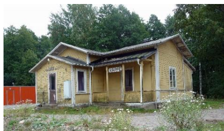
Råppe järnvägsstation 2013

Området var relativt orört fram till 1970-talet när Wessels byggdes. Efter det var det främst nya vägdragningar med Stora Råppevägen och väg 23 som påverkat området. De senaste åren har stora förändringar skett med rivningen av både stationsbyggnaden och stärkelsefabriken, byggnader som var centrala i förståelsen av godsets industriella verksamhet.