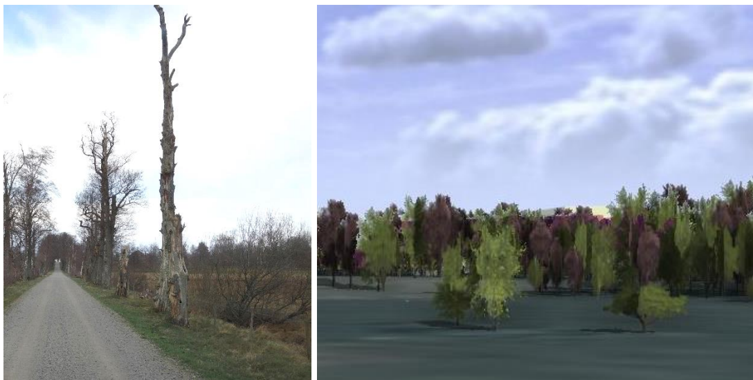
Siktlinje 3, sjukhusbyggnaden syns något bakom träden, troligtvis ytterligare när träd är lövfria.