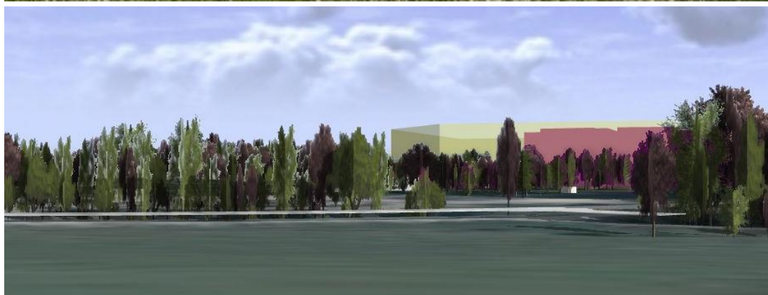
Siktlinje 4, sjukhusbyggnaden syns tydligt, stor skillnad mellan byggrätten och föreslagen sjukhusbyggnad.