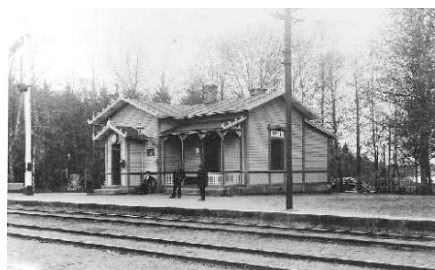
Räfte järnvägsstation 1902

1865 drogs järnvägen mellan Växjö och Alvesta genom området i öst-västlig riktning. En stationsbyggnad med tillhörande magasin uppfördes samma år, strax söder om spårområdet. Järnvägsstationen (revs 2016) fick en strategisk placering intill hamnbassängen i Räfte. Järnvägen blev en viktig del av Bergkvara gods industriella utveckling och 1876 anlades stärkelsefabriken i Räfte som under lång tid var av stor vikt för godsets ekonomi. Fabriken stängdes 2018 och i