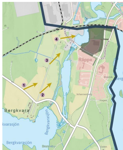
Studerade siktlinjer från centrumzonen

Den stora skalan på byggnationen och dess visuella påverkan på centrumzonen har i samrådsskedet bedömts innebära en risk för påtaglig skada på riksintresset. Högsta totalhöjden har inte sänkts i granskningshandlingen, då en lägre höjd på byggrätten omöjliggör ett sjukhus på platsen. Istället för att sänka byggrättens totalhöjd har fokus varit på hur utformningen av byggnader säkerställs för att inte störa de öppna vyerna från godset och därmed minimera påverkan på riksintresset. Byggnader för parkering och tekniska anläggningar har en lägre totalhöjd vilket innebär lägre byggnader på delar av området och en begränsning av byggrätten, vilket minskar påverkan på vyer från centrumzonen.