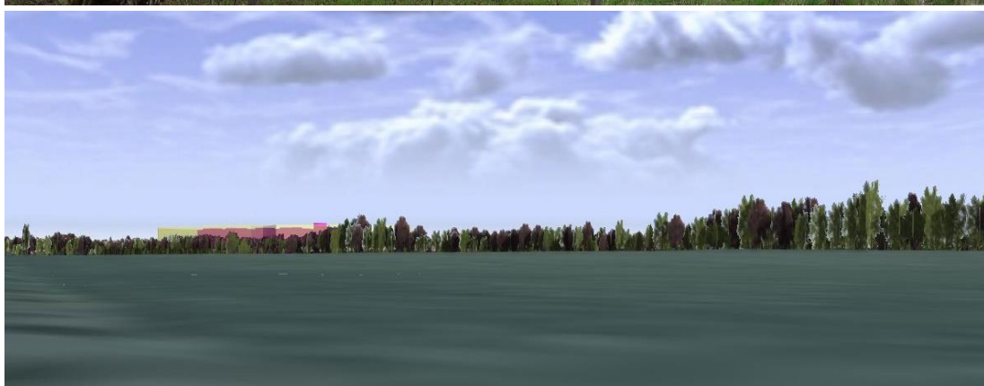
Siktlinje 1, sjukhusbyggnaden syns tydligt bakom träden.